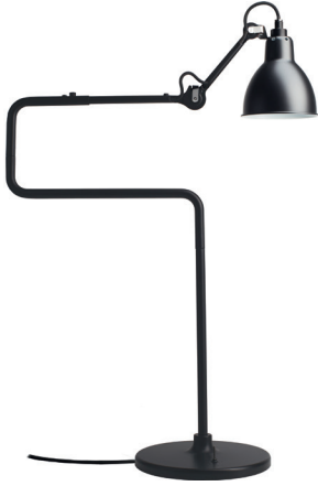
Table lamp | Lampe de table